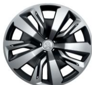
16" kryty kolies PLAKA (v sérii pre Active)