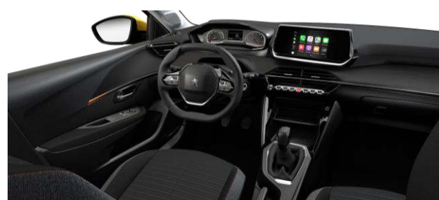
ACTIVE - Potah sedadiel PNEUMA 3D