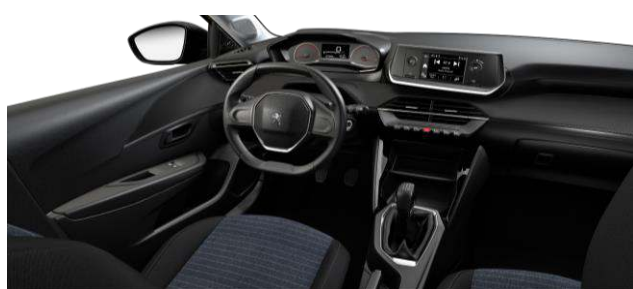
LIKE - Potah sedadiel PARA