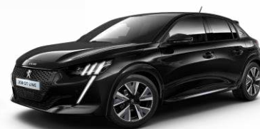
Čierna Perla Nera