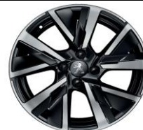
17" zliatinové disky JORDAAN