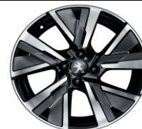
17" zliatinové disky CAMDEN (v sérii pre GT Line)