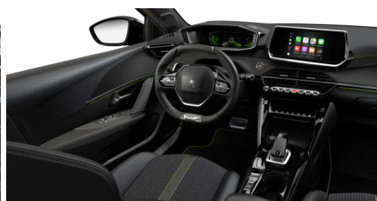
GT LINE - Potah sedadiel CAPY