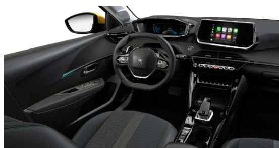
ALLURE - Potah sedadiel COSY