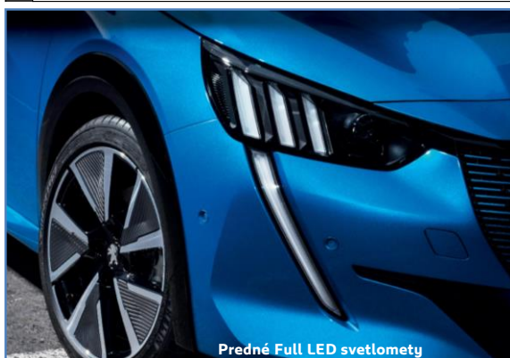
Predné Full LED svetlomety