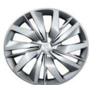
15" kryty kolies LAPA (v sérii pre Like)