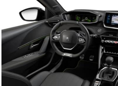
ALLURE / GT LINE - Kožený potah sedadiel NAPPA