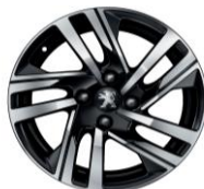
16" zliatinové disky SOHO (v sérii pre Allure)