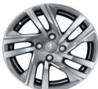
16" zliatinové disky TAKSIM