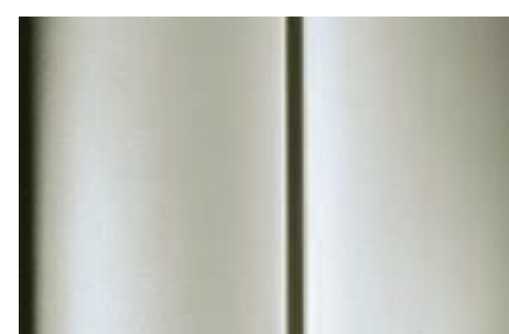
Golden White - metalická