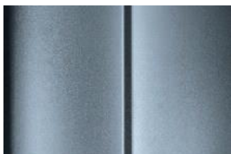
Sivá Aluminium - metalická*