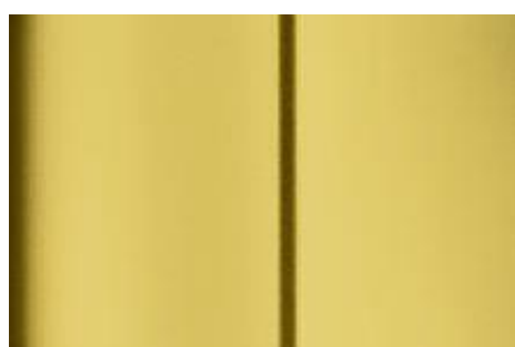
Žltá Carioca - matná*