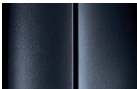
Sivá Graphito - metalická