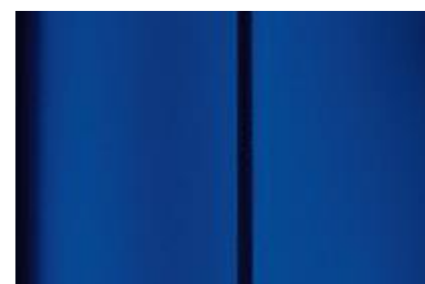
Modrá Line - matná