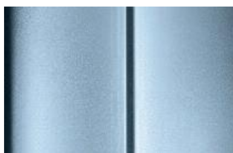
Modrá Lago Azzuro - metalická