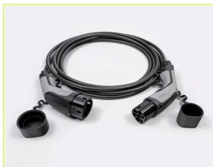
Kábel režimu 3 pre pripojenie do nabíjacej stanice (domáceho WallBoxu alebo verejnej stanice)