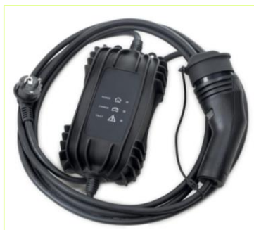
Štandardný kábel pre zapojenie do domácej 230V zásuvky 98 237 808 80