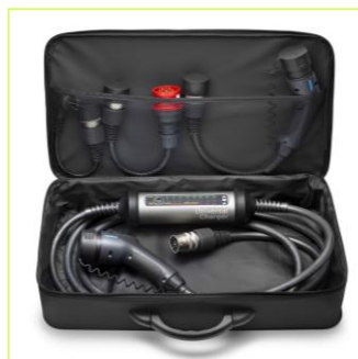
Súprava s nabíjacou jednotkou pre zapojenie do viacerých druhov elektrickej siete (230V/400V/WallBox)