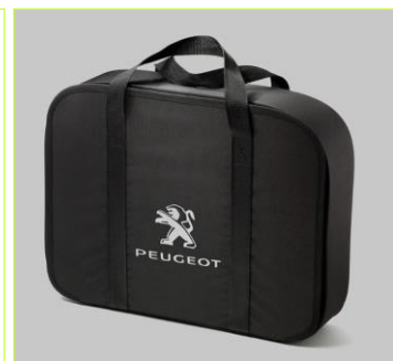
Taška na nabíjacie káble Peugeot 98 379 450 80