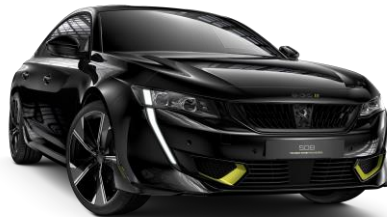
Čierna PERLA NERA